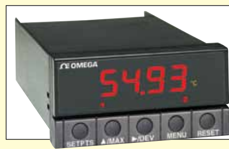
Serie DP25-TH 1/2 DIN, misuratori/regolatori di precisione a termistore.