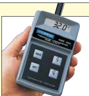
450-ATH termometro portatile ad alta precisione.