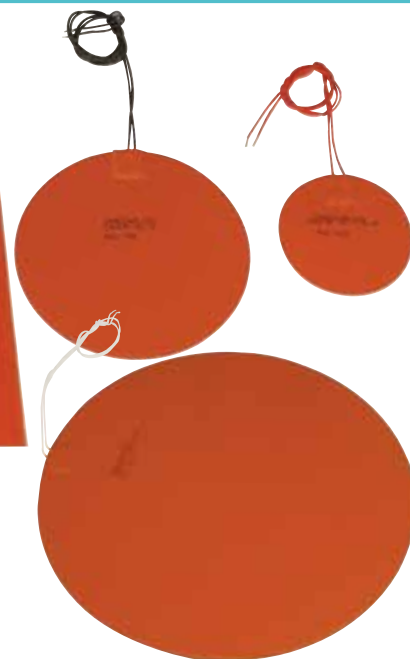
Serie SRF, mostrato più piccola delle dimensioni reali.

larghezza superano i 305 mm (12") utilizzano la linea ad avvolgitore. Effetto della densità di potenza: un riscaldamento dolce si ottiene con 2,5 W/in 2 . Unità funzionali per