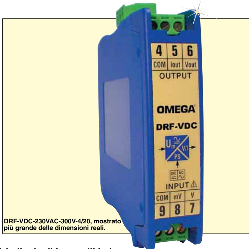
DRF-VDC-230VAC-300V-4/20, mostrato più grande delle dimensioni reali.

1000V per intervalli superiori a 100V, 500V per intervalli inferiori o uguali a 100V.