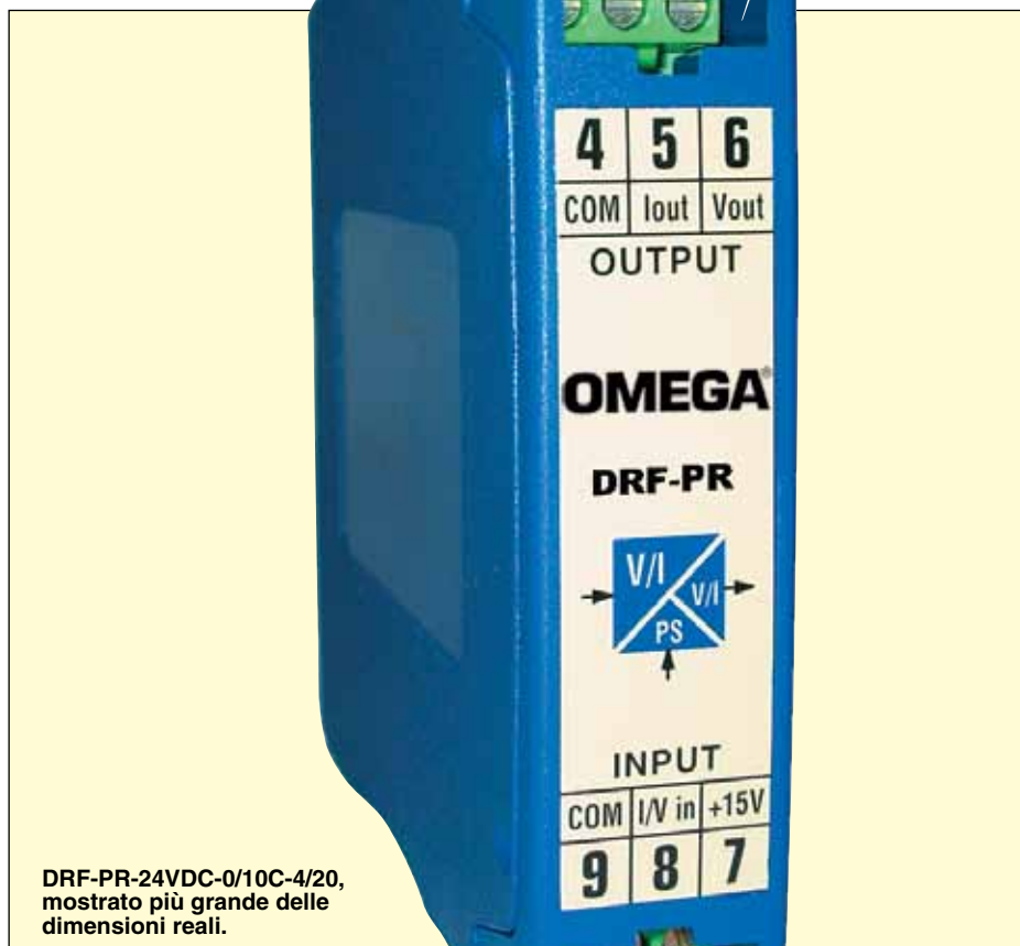
DRF-PR-24VDC-0/10C-4/20, mostrato più grande delle dimensioni reali.

Uscita Vexc per trasduttori: +15 V CC ±10% (max 22 mA).