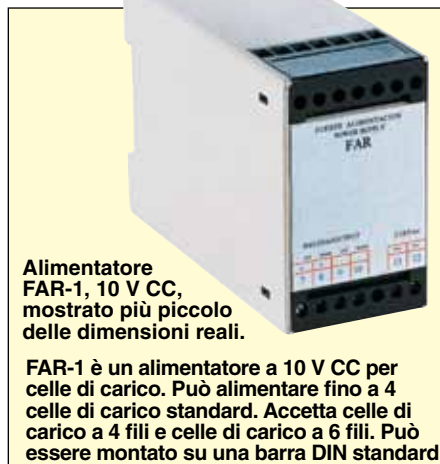
Alimentatore FAR-1, 10 V CC, mostrato più piccolo delle dimensioni reali.

FAR-1 è un alimentatore a 10 V CC per celle di carico. Può alimentare fino a 4 celle di carico standard. Accetta celle di carico a 4 fili e celle di carico a 6 fili. Può essere montato su una barra DIN standard.