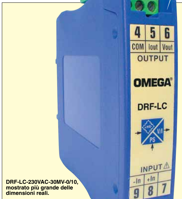
DRF-LC-230VAC-30MV-0/10, mostrato più grande delle dimensioni reali.