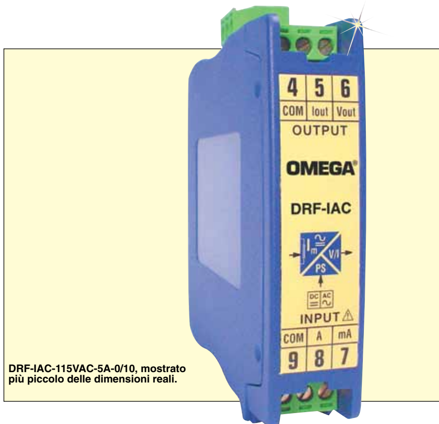
DRF-IAC-115VAC-5A-0/10, mostrato più piccolo delle dimensioni reali.

Protezione contro l'ingresso fuori intervallo: 7,5 A per intervalli superiori a 500 mA e inferiori o uguali a 5 A, 750 mA per intervalli inferiori o uguali a 500 mA.